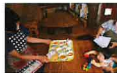
離乳食は、試食程度の提供量です。