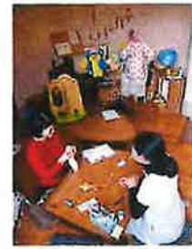
以前のワークショップ様子