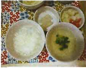
後期食のイメージ写真です

【春、木にはえ出した芽】という意味を持つ「木の芽」。赤ちゃんが食べ物を口にしながら、成長していくという生命力をイメージして「木の芽の会」とネーミングしています。これからも「木の芽の会」をよろしくお願いします！ 〔出典 岩波国語辞典〕